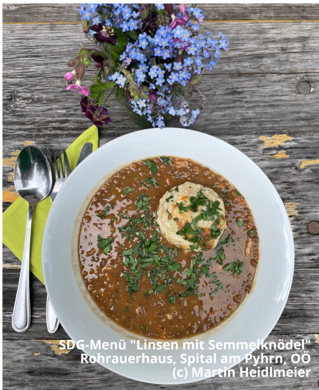
SDG-Menü "Linsen mit Semmelknödel" Rohracherhaus, Spital am Pyhrn, OÖ

SDG-Menüs zum Nachkochen: www.nf-int.org/sdg