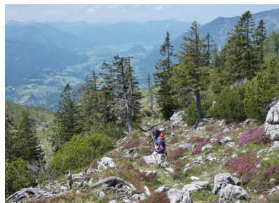
Hochglegt, Bad Ischl