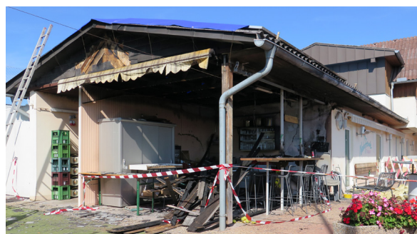
Alle Fotos: Naturfreunde Traun – Brand im Clubheim 2023

eingeholt. Bei der nächsten Vorstandssit-zung am 6. November werden wir hoffentlich schon mehr berichten können.