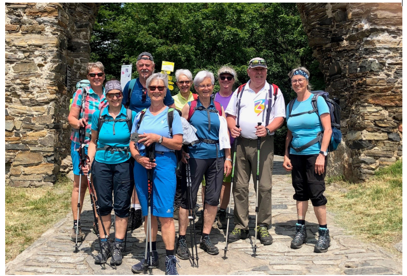
Foto: Kulturerbe Steig, Weißenkirchen-Spitz a. d. Donau – G. Pühringer Rechts: Impressionen von Referat Wandern und Bergwandern – R. Friereder

20. bis 22. September 2023 Gipfeltour Rax Höllental Hirschwang an der Rax