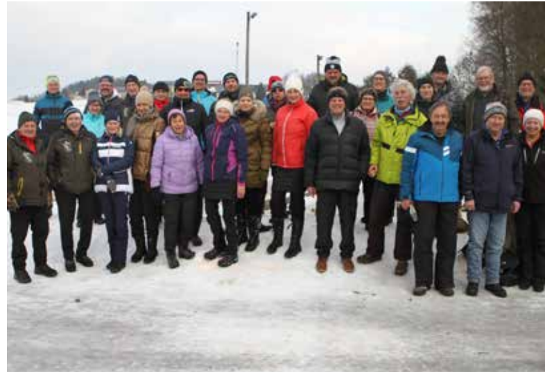
Alle Teilnehmer der Eisstock-Meisterschaft 2025/26