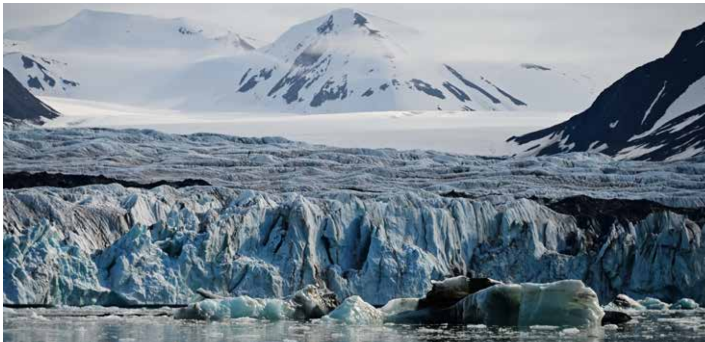
Alle Fotos: B. Richtsfeld – Spitzbergen

Spitzbergen ist der nördlichste Teil Norwegens und liegt mitten im Arktischen Ozean. Die Inselgruppe zählt zu den spektakulärsten Reisezielen Europas. Das Landschaftsbild ist geprägt von tiefen Fjorden, hohen Bergen und zahlreichen Gletschern.