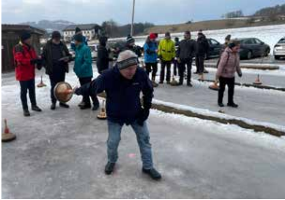
Eisstock-Meisterschaft 2025/26