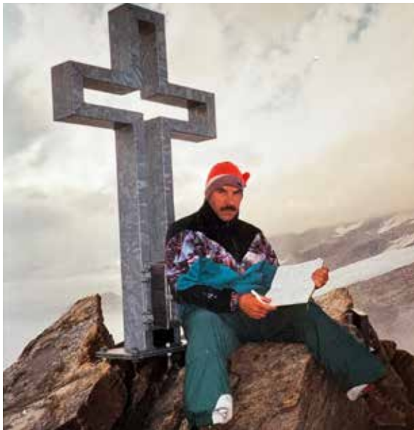
Hochalmspitze

„Früher und heute sind kaum vergleichbar. Die Menschen waren weniger mobil, deshalb wurden oft Fahrgemeinschaften gebildet, um gemeinsam zu Wanderungen oder Skitouren zu gelangen. Das hat auch den Zusammenhalt gestärkt.“