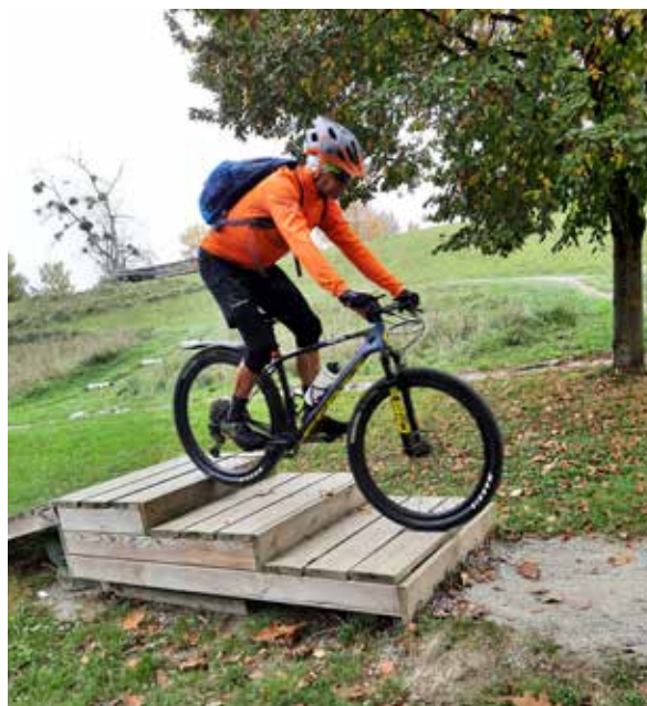
Kleines Mühlthal Bikepark Ottensheim